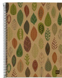
2872 エコリーフ 800円