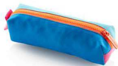
19543 ミニペンポーチ 2000円

再生ポリエステルを メイン生地とライナーに、 エコ素材のポリウレタンを 内部の仕切りに使用 しています。