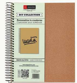
2194 DIY 800円