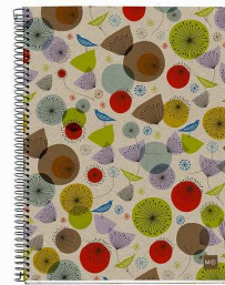
2463 エコパード 800円