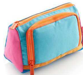
19542 折り畳みペンポーチ 2000円