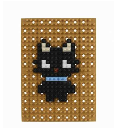
製品名: 「ドットアートキット サンリオ チョコキヤット」 色数・ブロックパーツ数: 6色・32本 価格: 800円(税別)