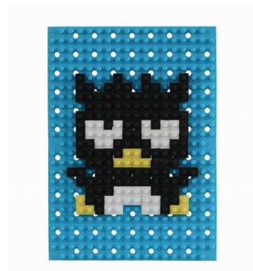
製品名: 「ドットアートキット サンリオ バッドばつ丸」 色数・ブロックパーツ数: 3色・42本 価格: 800円(税別)