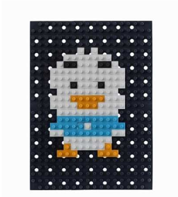
製品名: 「ドットアートキット サンリオ あひるのペックル」 色数・ブロックパーツ数: 4色・40本 価格: 800円(税別)