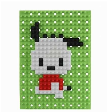
製品名: 「ドットアートキット サンリオ ポチャッコ」 色数・ブロックパーツ数: 3色・42本 価格: 800円(税別)