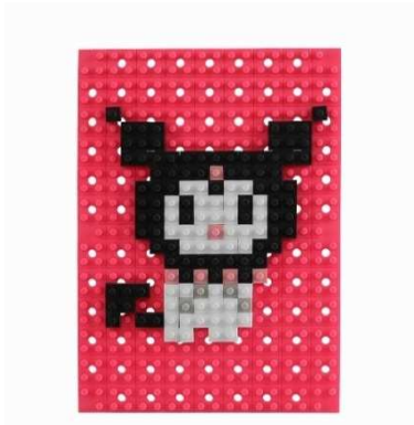
製品名: 「ドットアートキット サンリオ クロミ」 色数・ブロックパーツ数: 4色・35本 価格: 800円(税別)